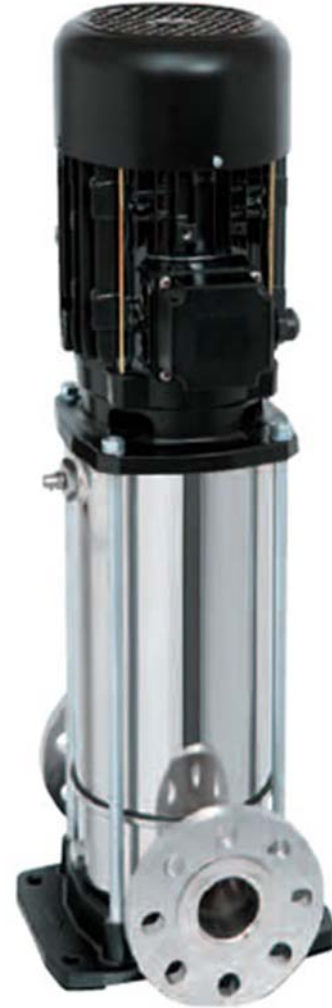
Bombas centrífugas multicelulares verticales